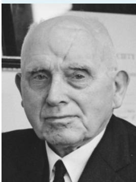
Seo é Sir James Martin. B'innealtóir Éireannach é. Cheap sé suíochán eisteilgthe d'eitleáin.

Cruthaíonn aireagóirí rudaí nua. Réitíonn siad fadhbanna. Cheap Sir James Martin an suíochán eisteilgthe le nach bhfaigheadh píolótaí bás in eitleáin.